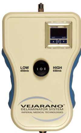
V Glide System™